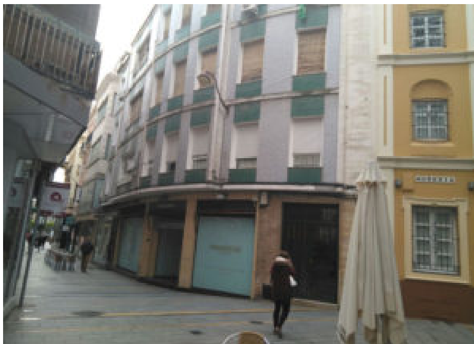
edificio de viviendas propiedad de la Iglesia en el centro de Córdoba

Basta poner en su buscador favorito de Internet la siguiente búsqueda: “propiedades de la iglesia católica en España IBI” para encontrar centenares de noticias que explican de hecho la imposibilidad de conocer todas las propiedades inmobiliarias de la Santa Iglesia. Igualmente, aparecen noticias de administraciones que han intentado poner blanco sobre negro el dinero que se ahorra esa Institución religiosa en impuestos. 0 enlaces a censos de todas las propiedades urbanas exentas de impuestos (catedrales, iglesias, colegios, hospitales, tierras, hoteles, pisos, garajes, etc) así como de la propiedad rústica eclesiástica.